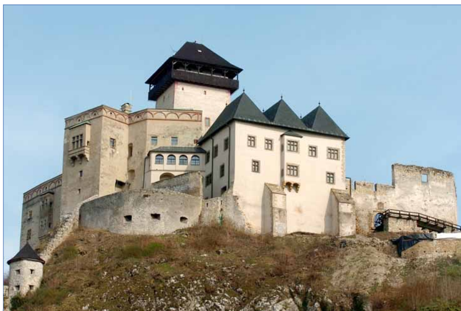
Trenčiansky hrad vlni navštívilo 71 tisíc ľudí

mestská samospráva tento rok vyčlenila približne 4,2 mil. Sk. Suma je rozdelená na čiastky v rozmedzí 50 až 500 tisíc Sk. Peniaze slúžia na účasť mesta na veľtrhoch CR, rozširovanie webových služieb, zavedenie jednotného vizuálneho štýlu na propagačných tabuliach, banneroch a reklamných materiáloch, doplnenie turistického značenia a orientačného systému v meste, ale aj na inzerciu v oblasti cestovného ruchu, podporu tvorby produktov cestovného ruchu či rozšírenie ponuky propagačných materiálov o meste. „Je veľmi relatívne