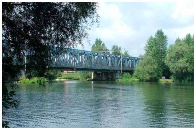
Po ukončení modernizácie železničnej trate by sa súčasný železničný most mal využívať ako most cestný