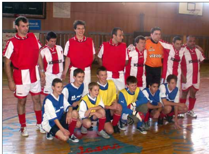
Zápas s Monakom bude jeho aktérom pripomínať aj spoločná fotografia Snímka (a)

Chlapci z oboch susedných trenčianskych škôl si za výkony