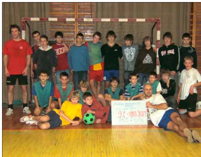
Po ukončení maratónu boli všetci unavení, ale šťastní, že to dokázali Snímka (a)