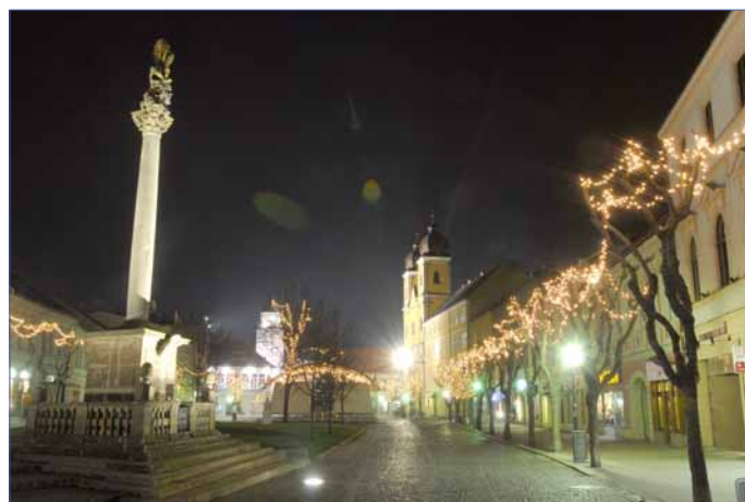
Trenčín v minulom roku navštívilo vyše sto tisíc ľudí, z toho približne štvrtina zo zahraničia. Najväčší záujem je o Trenčiansky hrad a centrum mesta.

povedať, či je to veľa alebo málo. Je naozaj veľmi ťažké zmerať, ako zvýšená propagácia prispieva či neprispieva k zvýšeniu návštevnosti mesta,“ domnieva sa R. Kaščáková. Všeobecne vraj platí, že propagácie nie je nikdy dost. „No nejde len o spoločnú propagáciu, ale najmä o stimuláciu podnikateľského prostredia k celkovému zlepšovaniu služieb či rozširovaniu ponuky pre návštevníkov mesta, o spo-