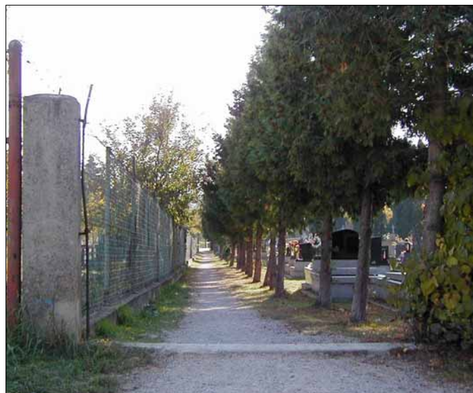
Skratku cez cintorín využívajú obyvatelia Širokej ulice

Výkriky staršieho občana s osobnými útokmi na poslancov rozvlnili pokojnú hladinu diskusie. Vadil mu nevyužitý mestský rozhlas či chýbajúci druhý most v Trenčíne. „ Rozhlas sa v Zlatovciach využíva, ale nemôže vysielat stále “, vysvetlil M. Barčák. K druhému