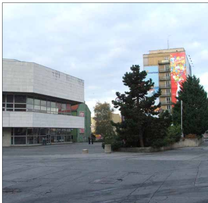
Mestské zastupiteľstvo v Trenčíne schválilo predaj pozemku na voľnom priestranstve vedľa Kultúrneho a metodického centra ozbrojených síl SR v Trenčíne bratislavskej spoločnosti Tatra Real