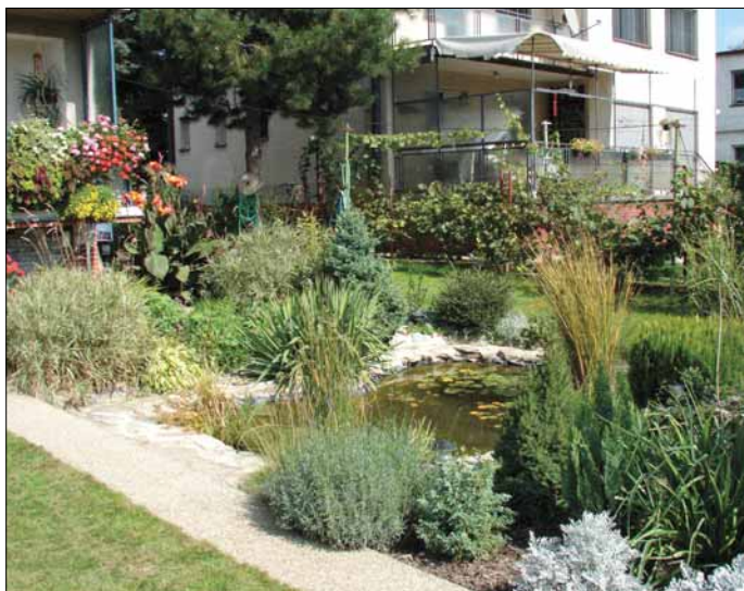
1. miesto, kategória C