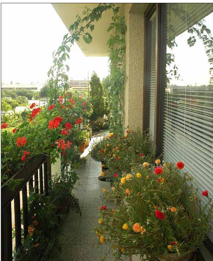
1. miesto, kategória A