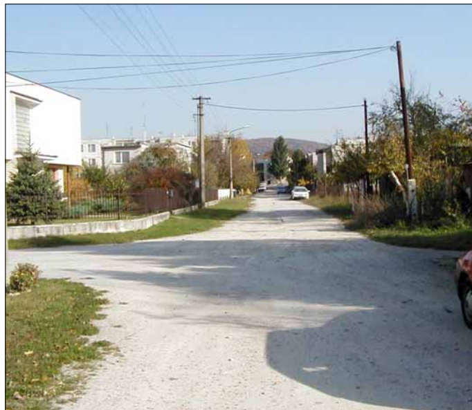
Široká ulica by sa skôr mohla volať Nerovná, prípadne Nedláždená

Občianka sa pýtala poslancov na rekonštrukciu ulíc Súhrady a Široká. A. Boc odpovedal, že povrch Širokej sa mal tento rok upraviť vyfrézovanou drvou, pokiaľ sa nevykoná rekonštrukcia. Občania protestovali proti tomuto riešeniu a tak zostala ulica nespevnená. Rekonštrukcia Širokej je naplánovaná na