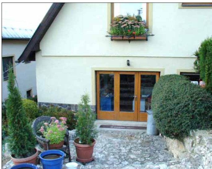
1. miesto, kategória B