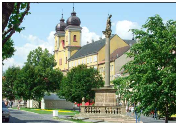
Jednou z dominant Mierového námestia je aj Morový stĺp

Mierové námestie bolo v roku 1987 po rozsiahlom stavebnom a architektonickom výskume vyhlásené za Mest-