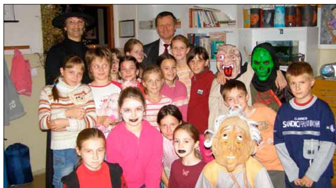
Na noc plnú tajomstiev sa jednotlivé triedy dobre pripravili

Vedúce katedriér – inak triedne učiteľky 2.-4. ročníka k tomu dodávajú: „Vo vyučovaní preferujeme hlavne zážitkové učenie. Načasovanie tejto akcie teda nebolo náhodné. Blížiac sa sviatky Všetkých svätých a Pamiatka zosnulých sa v poslednom čase začali spájať s Halloweenom a naše deti, podľahnúc komercializácii, preberajú tento americký zvyk. My sa chceme zamerať na naše slovenské tradície, oboznámiť deti s pôvodom týchto sviatkov, s ich významom. Pripravili sme študijné materiály s touto tematikou – visia v triedach, deti si ich so záujmom čítajú, diskutujeme o nich. Tiež chceme deťom pomôcť prekonávať strach. Ukážkami niekoľkých jednoduchých chemických a fyzikálnych pokusov sme dokázali fungovanie vecí a javov, ktoré naši dávni predkovia z neznalosti považovali za nadprirodzené a báli sa ich. Na hodinách čítania sa tiež venujeme ľudovým rozprávkam, kde vystupujú strigy, čarodějníci, vysvetľujeme si, koho v minulosti za takéto osoby označovali. Prejdením Cesty odvahy