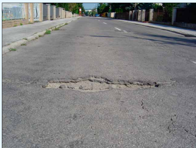
Ulica Jána Zemana na sídlisku Noviny je vo veľmi zlom stave. Najhoršie sú výtlky, hlboké aj 15 cm či trčiace kanálové vpuste. Čo urobia kompetentní?