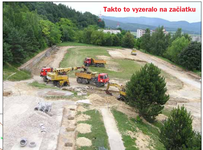
Takto to vyzeralo na začiatku