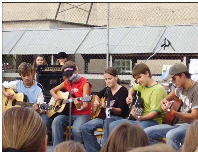
Na vystúpení zahrála i školská kapela

Súčastou koncertu bola i prezentácia populárnejšej