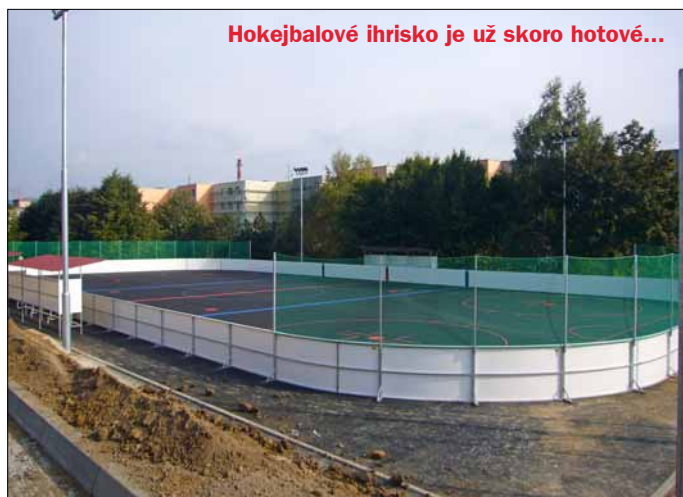
DVOJSTRANU PRIPRAVILO MESTO TRENČÍN