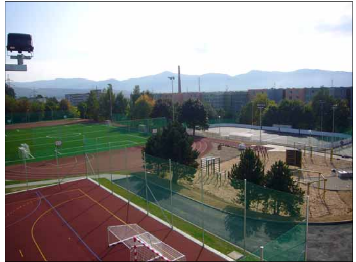
Pohľad na nový všešportový areál z vtáčej perspektívy