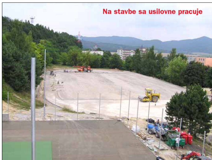
Na stavbe sa usilovne pracuje

javili, veď nadviazal na celoeurópsky trend budovania ihrísk. Naš areál je najväčší, čo má logiku, veď škola sa nachádza na najväčšom sídlisku a sú tu priestory na jeho vybudovanie. Nachádza sa v krásnom prostredí. Keď tam prídete, nájdete všetko na príjemný relax, nádhernú prírodu, zeleň, v susedstve je lesopark Brezina.