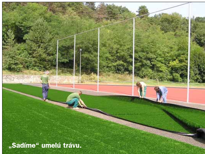
„Sadíme“ umelú trávu.

„Dlhoročným domovom Mestskej ligy malého futbalu