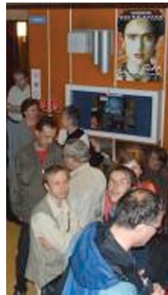
Artkino: ...do ktorého si diváci našli cestu nielen počas oficiálneho otvorenia (na snímke)

štívalo 52 830 divákov. Denná návštevnosť 14 predstavení dosahuje 417 divákov, čo predstavuje necelých 30 divákov na jedno predstavenie. R. Kliment hovorí, že