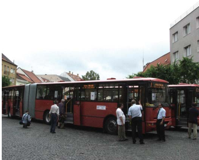
Po Trenčíne budú jazdiť aj nové „harmoniky“

Týmto spôsobom je k dnešnému dňu obnovených 51 % vozidlového parku MHD Trenčín, čím je dosiahnutá veková štruktúra