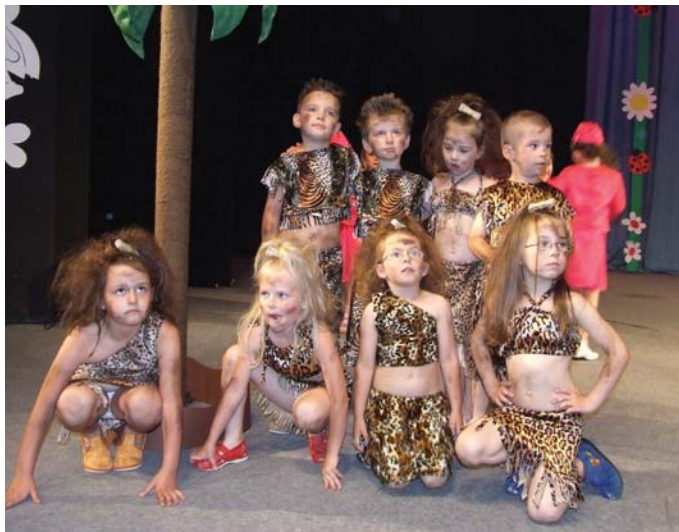
„Divoškovia“ z MŠ Nešpora 16

Nejeden profesionálny spevák alebo tanečník by iste závidel suverénnosť a zodpoved-