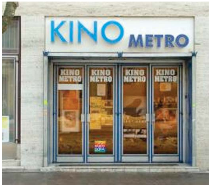
Kino Metro vo februári t.r. ukončilo svoju činnosť, nahradilo ho ArtKino...

ArtKino premieta od tretieho februára. Keď v trencianskom Maxe otvorili štyri moderné kinosály, predstavi-