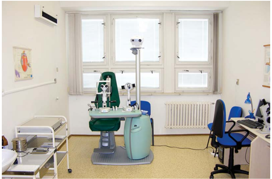
Pohľad na časť interiéru polikliniky

Vstup nových medicínskych odborov je podmienený etapa-