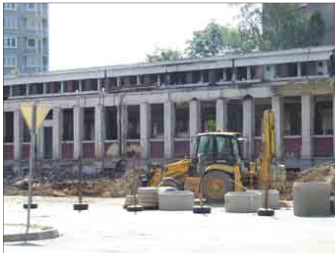
Na mieste bývalej Kotvy je dnes rušné stavenisko. Na jar 2007 tu má stáť polyfunkčný objekt Magnus Center

ako aj zaujímavým architektonickým riešením sa zaradí k moderným polyfunkčným objektom mesta. (mr)