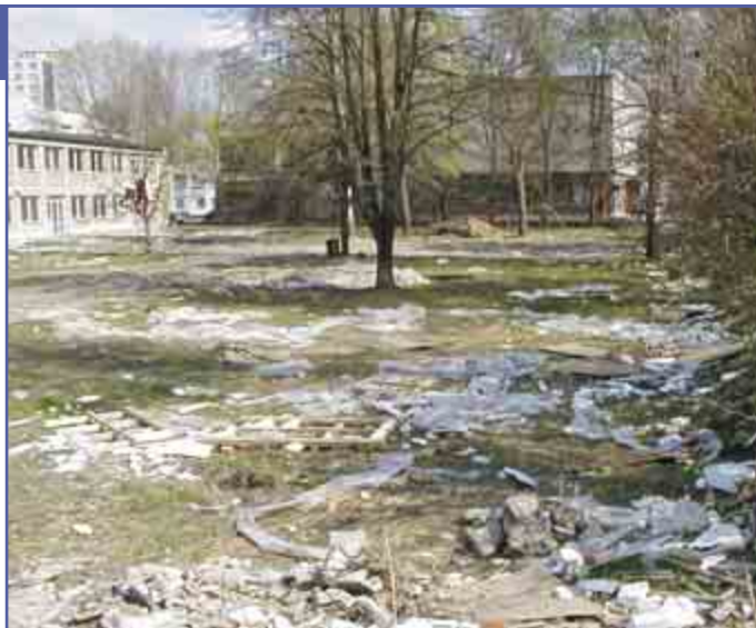
„Romantické“ zákutie vo dvore bývalej materskej školy Pod Sokolicami

Pri kyselke občan z Dolnej Poruby vysypal odpad, priestupok vyriešila mestská polícia pokutou a musel odstrániť aj odpady. J. Babič požiadal Mestské hospodárstvo a správu lesov o záhradnícke úpravy terénu pri obchodnom stredisku Rozkvet, ďalej poukázal na porušenie podmienok zmluvy firmou STIP pri výstavbe objektu, parkovacích miest a likvidácii detského ihriska. Neoznačené vyfrézované výtlky, pripravené na opravu dva týždne, sú traumou pre vodičov na cestách v tejto časti mesta. Ďalej uviedol, že mládež demo-