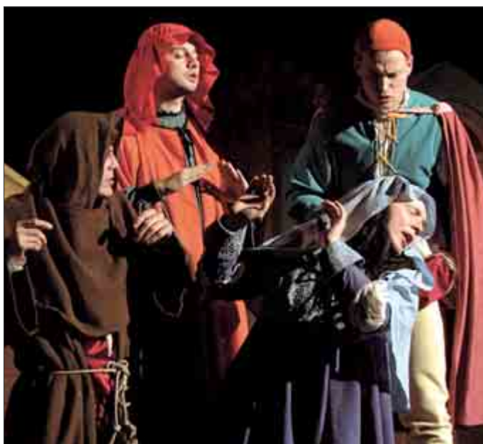
Machiavelliho šťavnatú komédiu Mandragora uviedlo divadlo na Valentína 14. februára spolu so súťažou o nápoj lásky